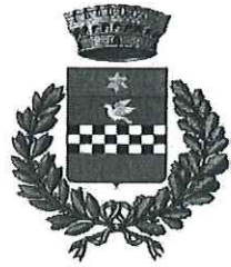
COMUNE DI LAGANADI