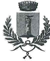
COMUNE DI CALANNA