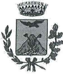
COMUNE DI CARDETO