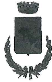
COMUNE DI SANT'ALESSIO IN ASPROMONTE